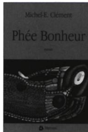
Michel-E. Clément PHÉE BONHEUR Roman, 281p., 22 $

Tout un essaim de personnages bourdonnent autour d'une héroïne charismatique à souhait. Elle s'appelle Phée. En pleine Deuxième Guerre, après son mariage avec un veuf, elle troque sa vocation d'institutrice contre celle de boulangère. Enseigner lui avait communiqué la grâce d'allumer les intelligences. La boulangerie lui apprendra à pétrir les âmes. Une formidable reconstitution du Québec d'après-guerre: 1943-1959.