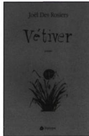
Joël Des Rosiers VÉTIVER Poésie, 145 p., 25 $

Trois narratrices nous content ici l'histoire d'une famille réunie pour la triste circonstance d'un décès. En de très courts chapitres, les narratrices donnent leur «vision des choses», soupèsent leur marge d'erreur et évaluent les comportements. Il n'est pas question de procès, mais plutôt de mises en perspective subtiles qui créent une atmosphère de réalité, et même de vérité, face à laquelle le lecteur ne peut qu'être confronté.