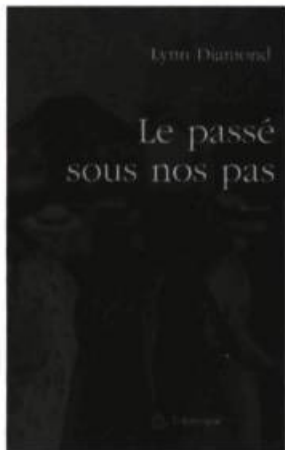
Lynn Diamond LE PASSÉ SOUS NOS PAS Roman, 166 p., 18 $

Tél. et téléc.: (514) 597-1666 Site Web: www.generation.net/tripty