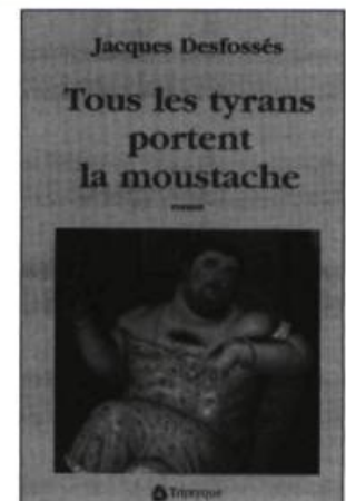
Jacques Desfossés TOUS LES TYRANS PORTENT LA MOUSTACHE Roman, 280 p., 22 $

Tout un essaim de personnages bourdonnent autour d'une héroïne charismatique à souhait. Elle s'appelle Phée. En pleine Deuxième Guerre, après son mariage avec un veuf, elle troque sa vocation d'institutrice contre celle de boulangère. Enseigner lui avait communiqué la grâce d'allumer les intelligences. La boulangerie lui apprendra à pétrir les âmes. Une formidable reconstitution du Québec d'après-guerre: 1943-1959.