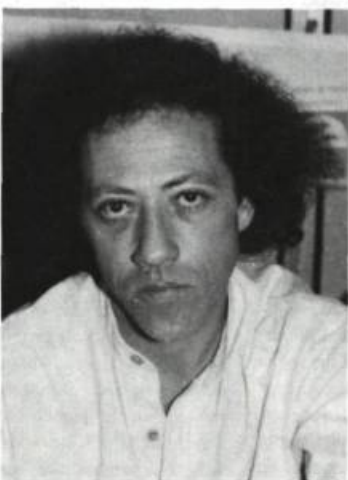
Yves Boisvert Vitraux d'éclipse Écrits des Forges