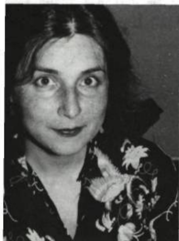
Chantal Hébert Le burlesque au Québec Ed. HMH