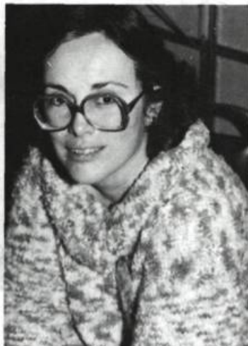
Célyne Fortin Femme fragmentée Éd. du Noroît