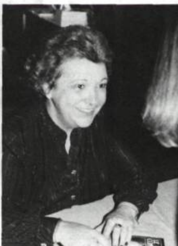
Lise Payette Le Pouvoir ? Connais pas Québec-Amérique