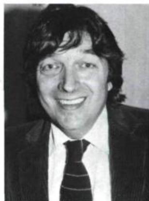
Roch Carrier Le Cirque noir Stanké