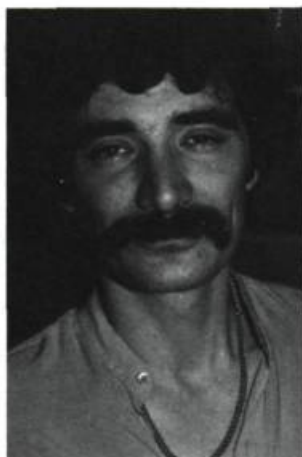
André Carpentier Du pain des oiseaux VLB éditeur