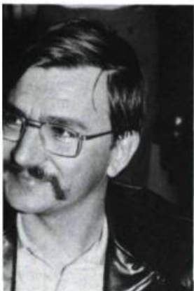
Gérard Gévy L'Homme sous vos pieds Éd. Quinze