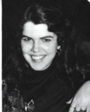
Chrystine Brouillet Chère voisine Éd. Quinze