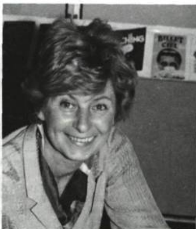
Ghislaine Meunier-Tardif Vies de femmes Éd. Libre Expression