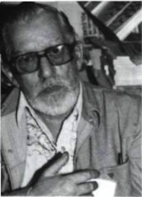
Yves Thériault Victor et le grand canot VLB éditeur