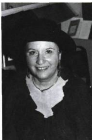
Charlotte Boisjoli La Chatte blanche Éd. La Pleine lune