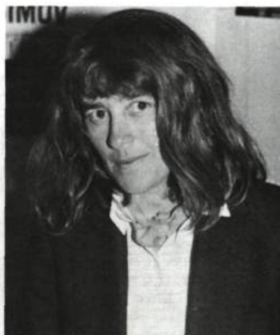
Marie-Claire Blais Visions d'Anna Stanké