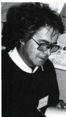
Gatien Lapointe Barbare inouï Écrits des Forges