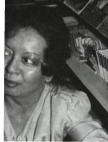
Claire Silvera Rochon Mon âme en liberté Éd. Paulines