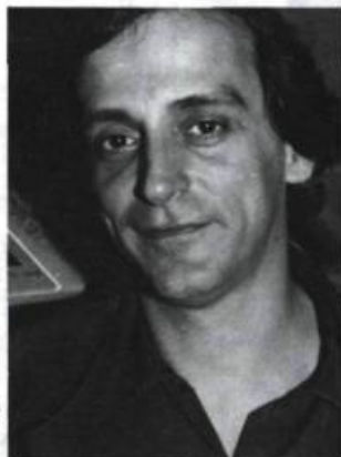
Jacques Lanctôt Affaires courantes VLB éditeur