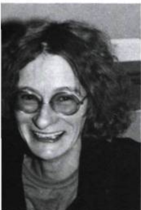
Geneviève Amyot Dans la pitié des chairs Éd. du Noroît