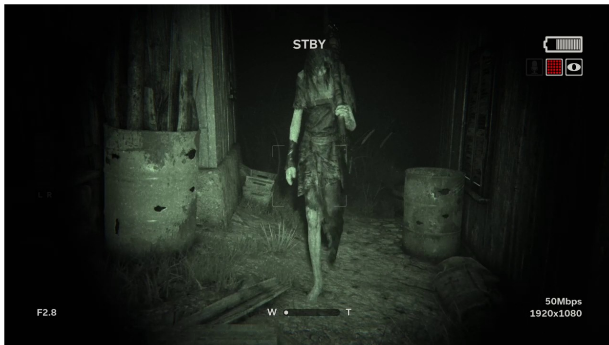
Figure 2 : Une première confrontation dans Outlast 2.

murmurer des litanies près de lui ; une femme immense vêtue de haillons se détache de l'obscurité, armée d'une pioche (Figure 2). Blake n'a d'autre choix que de fuir pour ramper sous la palissade d'une grange.