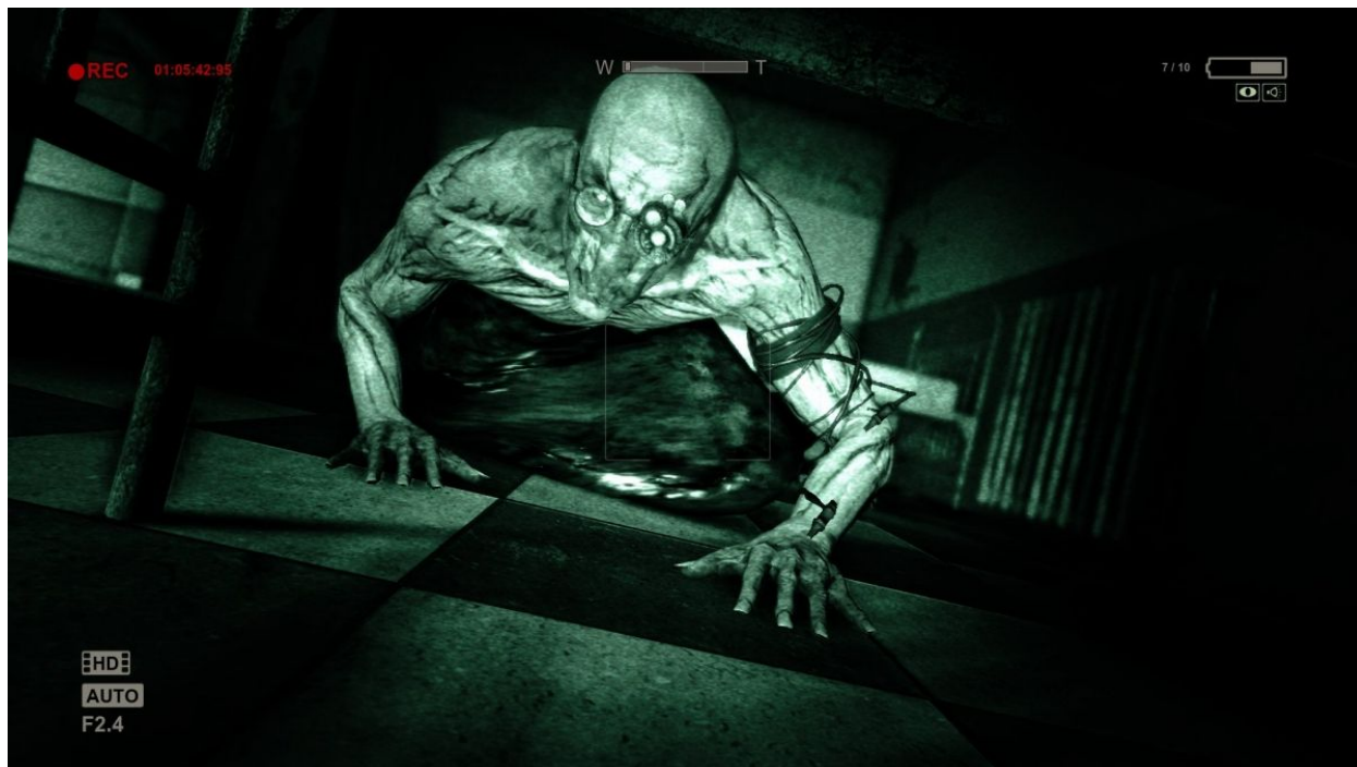
Figure 3 : La mince protection de l'objectif dans Outlast.

du regard qui prend la forme de constants paris, d'une succession de sauts dans l'inconnu : le joueur choisira-t-il d'avancer dans le noir pour économiser ses piles au risque de ne pas voir ce que dissimulent les ombres ? Utilisera-t-il ses piles jusqu'au bout avant de les changer, en sachant que la caméra pourrait tomber en panne dans un instant critique ? S'aventurera-t-il à fouiller chaque recoin à la recherche de recharges ou préférera-t-il fuir le plus rapidement possible pour éviter les affrontements ? Ce calcul des risques qui concernait les munitions dans le survival horror classique est ici transposé à la capacité scopique. Là où les armes permettaient de maintenir la distance avec le monstre et de retourner la violence contre lui, la caméra permet de dominer le regard. Le joueur est donc naturellement invité à tout observer à travers son objectif, à conserver cette maigre médiation entre lui et l'horreur (Figure 3).