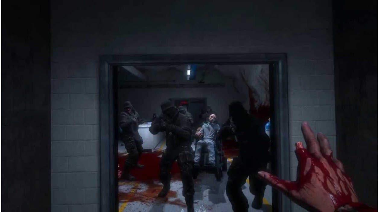
Figure 5 : “Whoever finds my corpse - trust no one and tell everyone” .

Waylon Park, lui, remonte l’axe vertical. Son périple commence là où se termine celui de Miles Upshur. Au cours de son ascension, il croise le père Martin qui laisse ses indications sur les murs. Le prêtre le rassure : il est en train d’accomplir son travail. Waylon sent lui aussi l’appel d’une vocation. Il écrit :