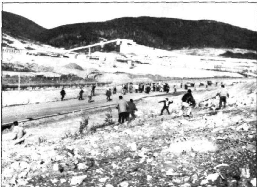
Affrontement contre "scabs" et piqueteurs