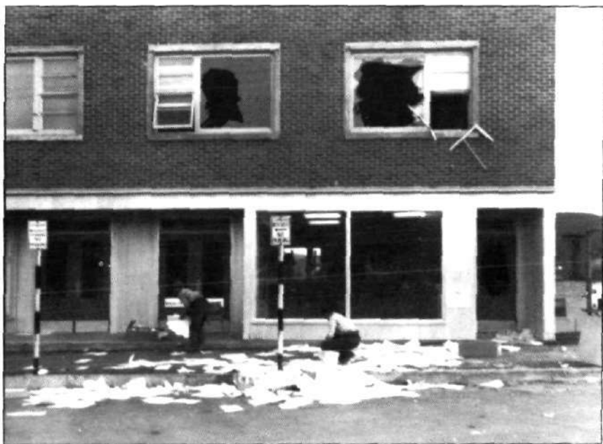
Mise à sac du local du syndicat des métallurgistes unis d'Amérique