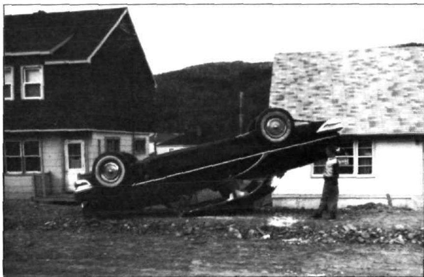
Grève de Murdochville, Gaspé, Québec, août 1957.