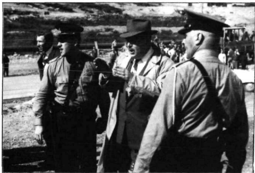
Claude Jodoin, président du Congrès du Travail du Canada, s'entretient avec des membres de la Police provinciale à Murdochville pendant la grève, août 1957.

— enfin, "les gardiens de la paix arrivent —"