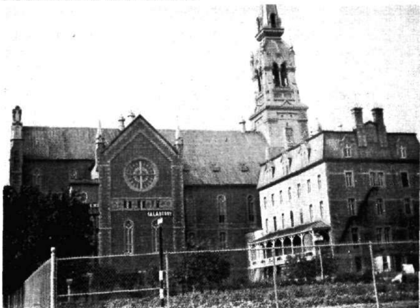
L'église Notre-Dame de Hull et le presbytère des Oblats de Marie Immaculée, 1943. The rectory housed as many as 21 priests and brothers engaged in the pastoral and social ministry of the parish as well as various other tasks, such as teaching and journalism, in Hull and Ottawa.