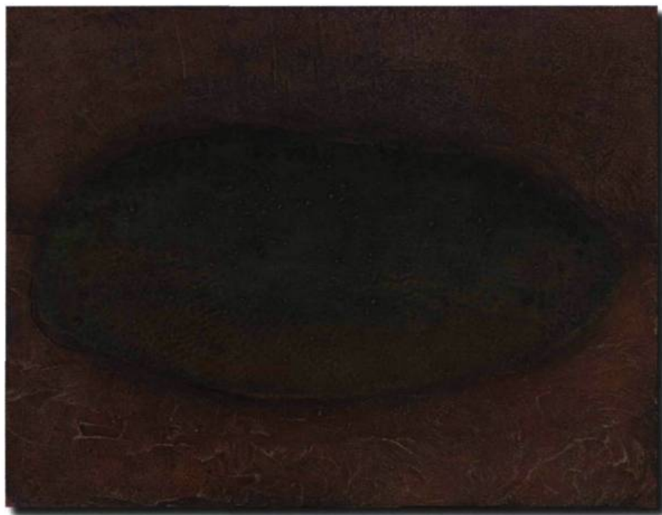
Pierre philosophique (du Salagou), 20 x 24 po

comme un objet simple ou un symbole fondamental. Le corbeau, le cœur, les bateaux de pêche, la table et les pierres philosophiques sont autant de thèmes exploités par Robichaud au cours des dernières années.