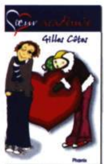
Cœur académie GILLES CÔTÉS