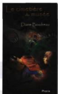
Le cimetière du musée DIANE BOUDREAU