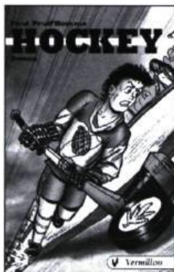
Paul Prud'Homme, Hockey : amour, drogue et drame , roman, Ottawa, Vermillon, 2002.

Un livre qui saura certainement rallier les jeunes partisans de hockey et qui acclimatera tous les lecteurs de 9-12 ans au monde parfois cinglant des athlètes.