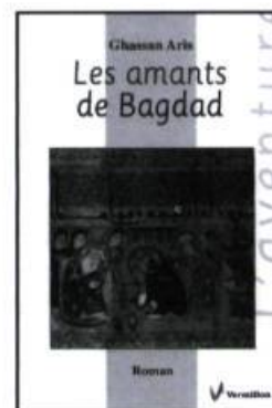
Ghassan Aris, Les amants de Bagdad , éditions du Vermillon, coll. « L'aventure », Ottawa, 2000, 161 p.

Une belle lecture pour tout le monde ! ●