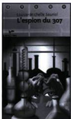
Louise-Michelle Sauriol, L'Espion du 307 , éditions Vents d'Ouest, coll. « ados », Hull, 2001, 161 p.