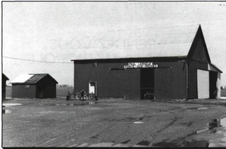
Une francophonie qui s'affirme