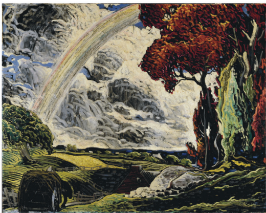
Marc-Aurèle Fortin, L'Arc-en-ciel, 1934 ou 1935 © Fondation Marc-Aurèle Fortin / SOCAN (2020)