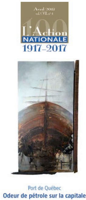
Port de Québec Odeur de pétrole sur la capitale