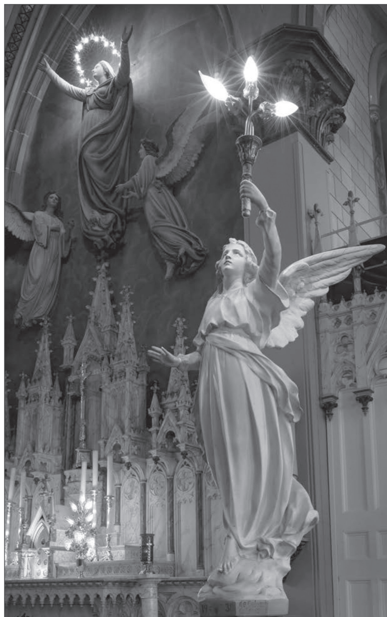
Photo: Normand Rajotte, Conseil montréalais de la culture et des communications, 2010.

Détail du chœur de la cocathédrale Saint-Antoine-de-Padoue, Longueuil.