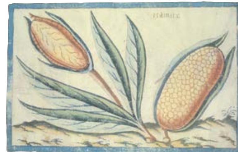
Du maïs rudimentaire. Samuel de Champlain