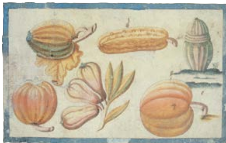
Des courges et des citrouilles de l'Amérique. Samuel de Champlain