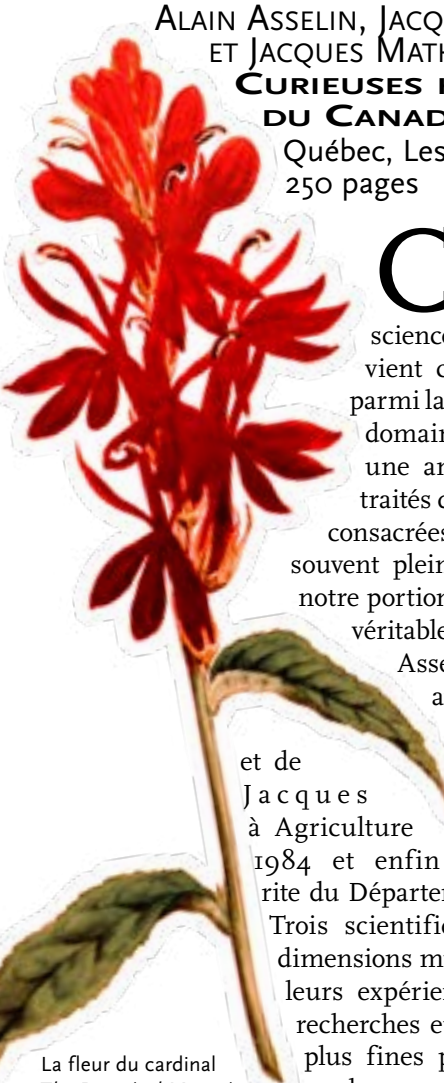
La fleur du cardinal The Botanical Magazine

En introduction, les auteurs nous rappellent la place et les rôles essentiels du monde végétal et la dépendance vitale des sociétés humaines à son égard: en plus de fournir l'oxygène à la biosphère, «l'or vert», ainsi le nomment-ils, compose la base de la plupart des pyramides alimentaires. Le savoir sur les plantes, écrivent-ils aussi, fait partie du patrimoine historique, culturel et scientifique des civilisations, bien que leur connaissance et leur influence ne soient pas encore connues dans les fins détails. Les auteurs font preuve d'humilité et témoignent de leur prudence lorsqu'ils affirment que l'histoire détaillée des plantes canadiennes, si palpitante et pleine de rebondissements soit-elle, ne fait que commencer. De fait, il ne s'agit ici que du premier tome de cet essai couvrant la période des découvertes et des premières explorations: il inclut un coup d'œil sur la présence des Vikings et de leur vinland , à Terre-Neuve vers l'an 1000, pour enchaîner ensuite avec les XVI e et XVII e siècles et se terminer avec les écrits du missionnaire naturaliste Louis Nicolas, présent en Nouvelle-France jusqu'en 1675. Le second tome en préparation nous fera découvrir plus tard les auteurs et les œuvres du siècle suivant qui sera clos avec la fin du Régime français en 1760.