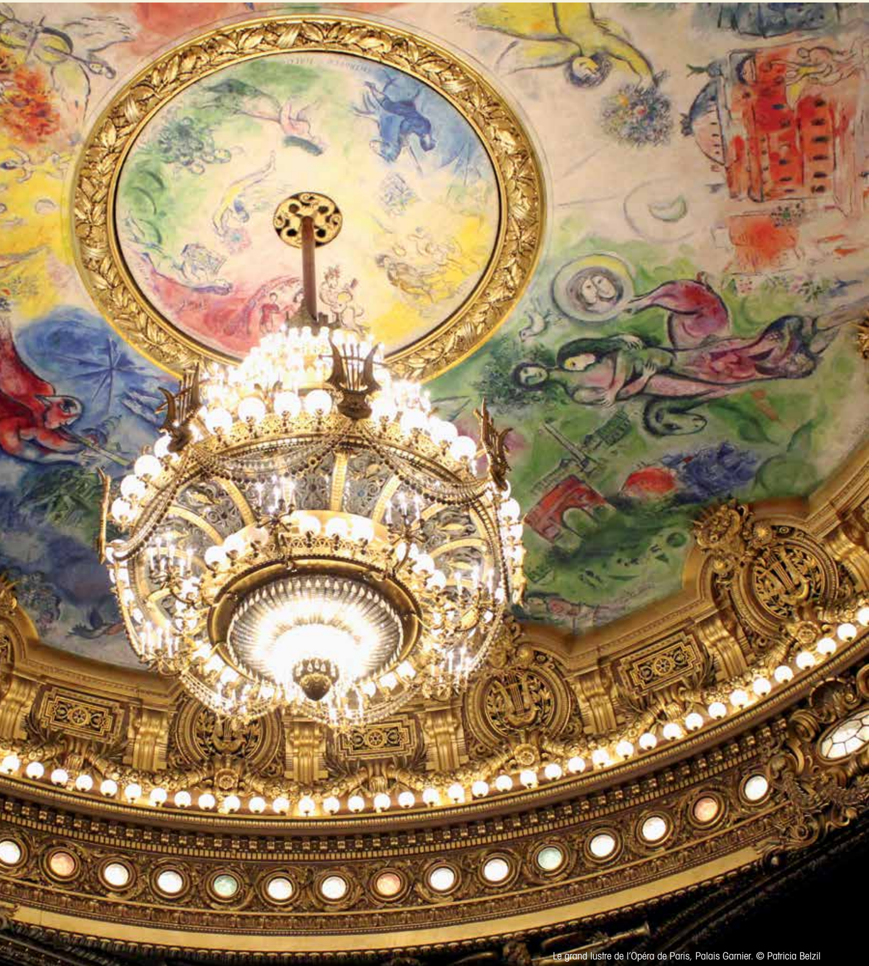
Le grand lustre de l'Opéra de Paris, Palais Garnier.