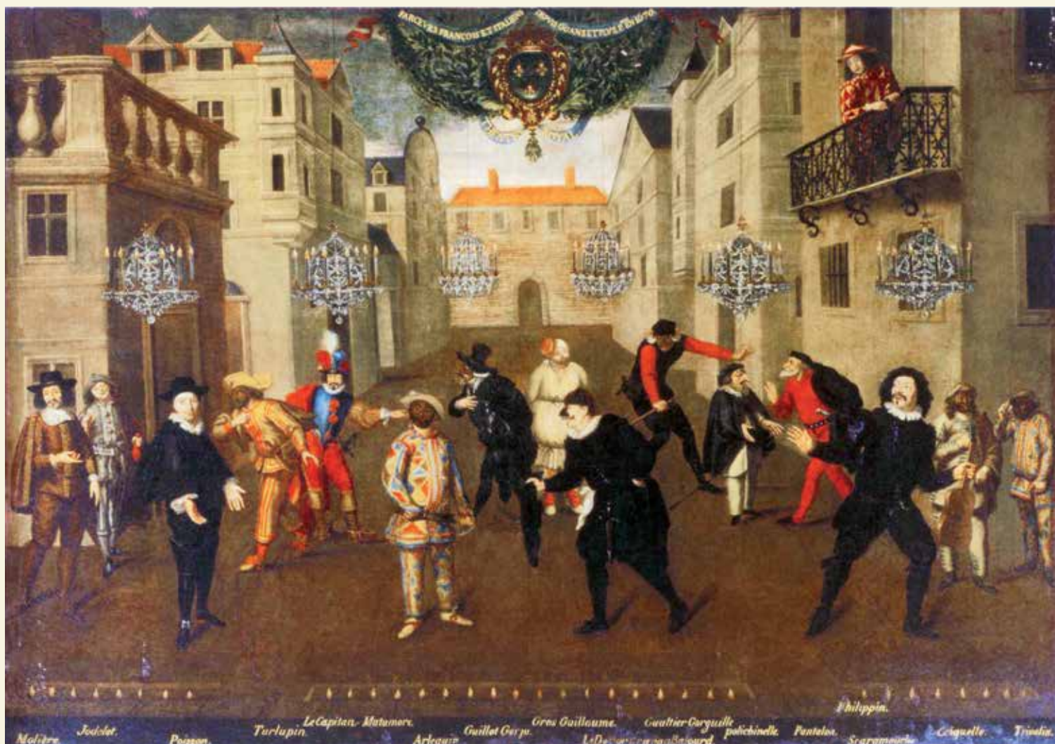
Les Farceurs français et italiens depuis 60 ans et plus peints en 1670, tableau attribué à Verrio. À gauche, Molière dans le costume d'Arnolphe.

on utilise plutôt la chandelle qui, fuligineuse, produit peu de lumière mais beaucoup de suie, de fumée et d'odeur. Un « moucheur » devait donc ôter la partie brûlée de la mèche avec des ciseaux et une « mouchette » toutes les 10 à 30 minutes, selon la qualité des chandelles. Cela coûtait cher. Molière a été emprisonné en 1645 parce qu'il devait 142 livres à son marchand de chandelles. (Corvin) 3 .