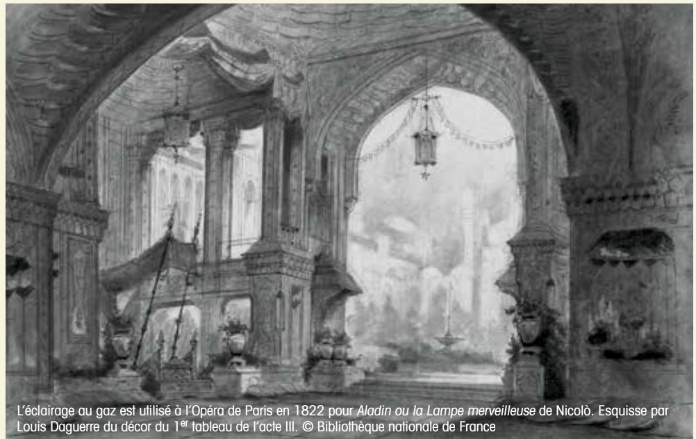
L'éclairage au gaz est utilisé à l'Opéra de Paris en 1822 pour Aladin ou la Lampe merveilleuse de Nicolò. Esquisse par Louis Daguerre du décor du 1 er tableau de l'acte III.