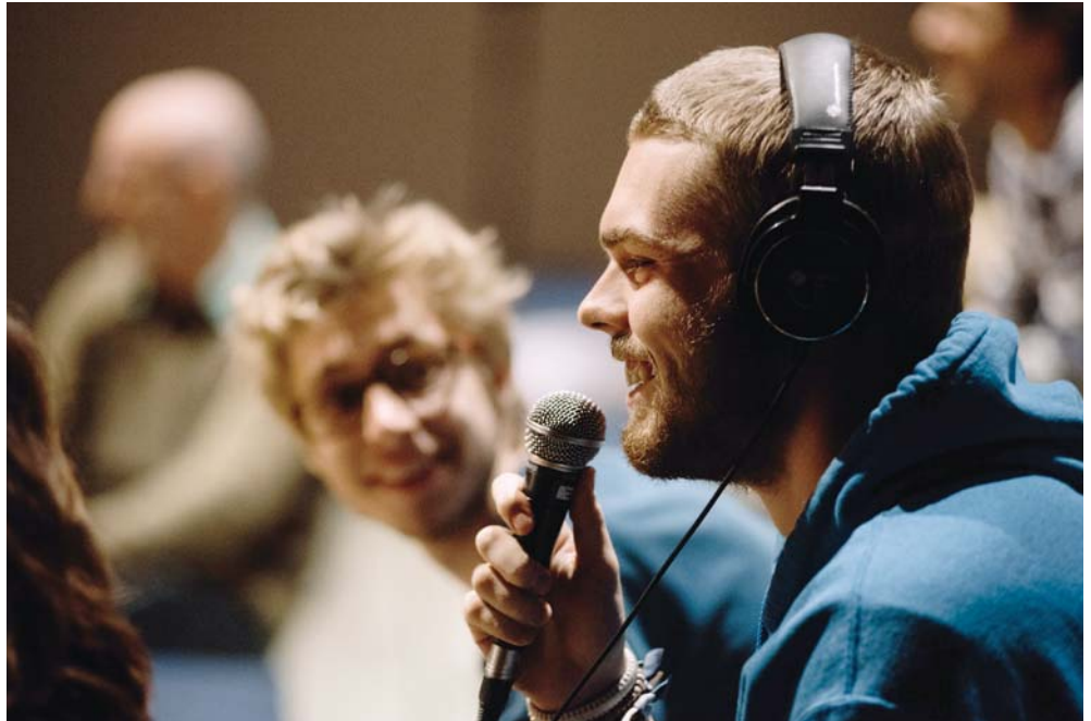
Inven(taire) à vif mis en scène par Ricardo López Muñoz (Théâtre du Tandem), présenté au Musée d'Art de Rouyn-Noranda en septembre et en octobre 2018. Sur la photo : un spectateur livre un récit.