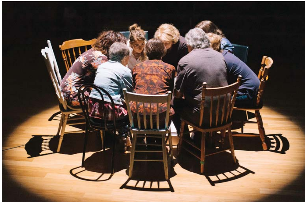
Inven(taire) à vif mis en scène par Ricardo López Muñoz (Théâtre du Tandem), présenté au Musée d'Art de Rouyn-Noranda en juin 2018.