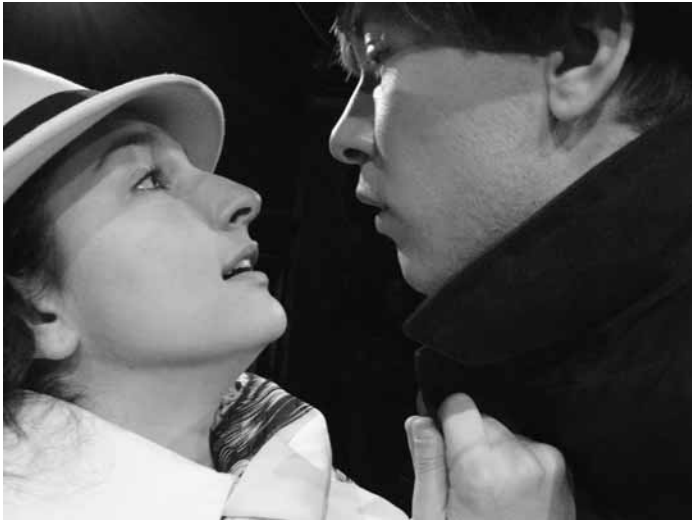
N'habbek/Je t'aime de Louis-Dominique Lavigne, mis en scène par Lise Gionet (Théâtre de Quartier, 2009).