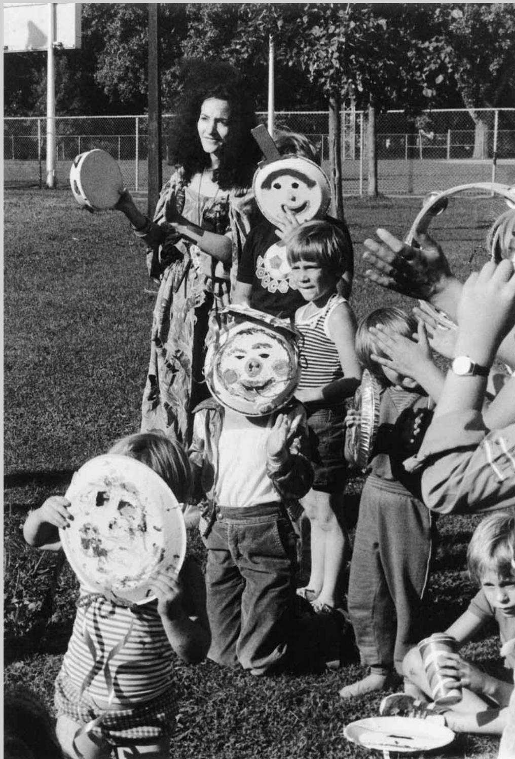
Le 8 e Festival québécois de théâtre pour enfants, présenté par l'AQJT au parc La Fontaine en août 1981.