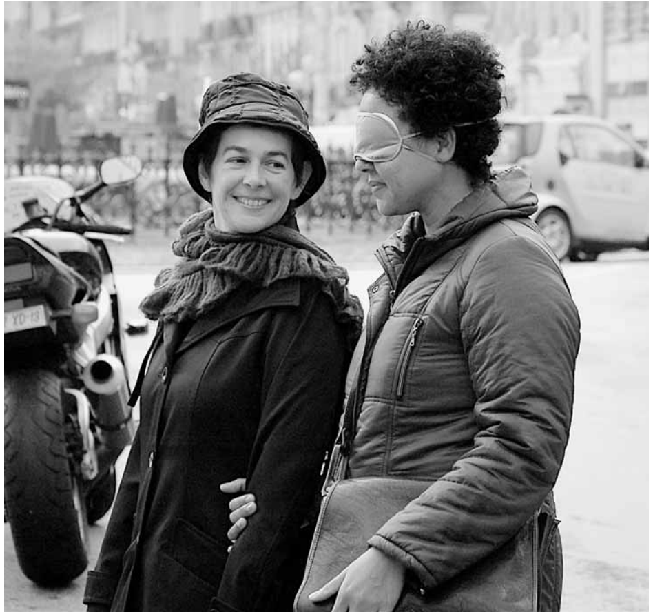
Tu vois ce que je veux dire ? , parcours à l'aveugle proposé par Martial Chazallon et Martin Chaput, présenté au FTA 2010.