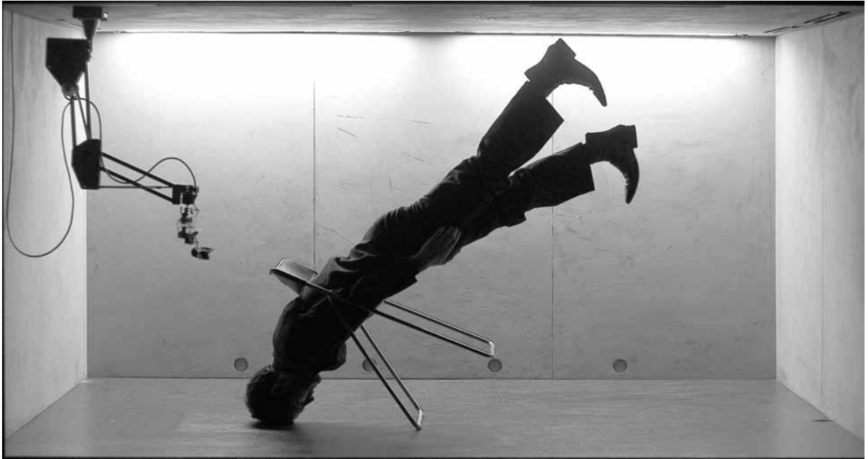
Press de Pierre Rigal (France), présenté à l'Agora de la danse à l'automne 2009.

droite, à la distorsion et à l'épuisement sous l'action répétée de la chute. Les corps se métamorphosent, tout comme le costume qui se déchire, se dissout et se salit au contact de l'eau puis de l'encre.