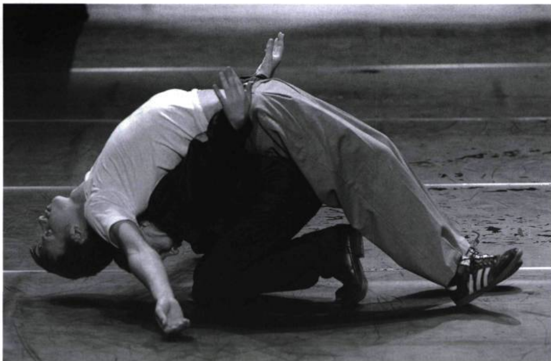
Swan Lake, 4 acts , chorégraphie de Raimund Hogue, présentée au FIA 2008.

un jeu de chaise musicale. Dans cette atmosphère calfeutrée, la danse dégage un charme mystérieux, mais aussi un enfermement. Le bruit d'une goutte d'eau qui tombe évoque une ambiance caverneuse. Sous la surface, sous les lignes pures, des gémissements se développent, un secret se diffuse. Avec leurs longues jambes, telles des sirènes, les danseuses entonnent le chant des mers. Elles envoûtent. Les ombres accentuent ce climat presque maléfique, cérémoniel. Se déplaçant avec contrôle comme sur un jeu d'échecs, les corps se positionnent, s'accordent, s'esquivent. Une séquence de poses et de clichés. La force côtoie l'élégance. La pureté et l'occulte se confondent... les quatre femmes glissent le long des tourments, de la folie.