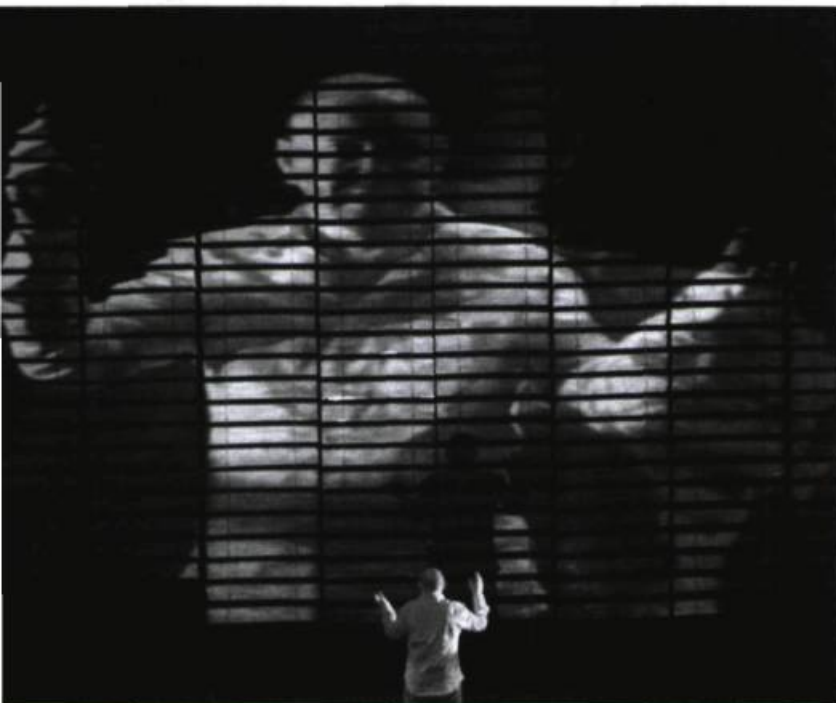
Rouge décanté , mis en scène par Guy Cassiers (Toneelhuis/ro theater) et présenté au FTA 2007.

être dite ; les équipes de la Toneelhuis d'Anvers et du ro theater de Rotterdam auront transformé l'expérience et l'œuvre de Brouwers en un redoutable dispositif théâtral qui prend le spectateur au piège, fût-il un Québécois étranger aux horreurs de la guerre.