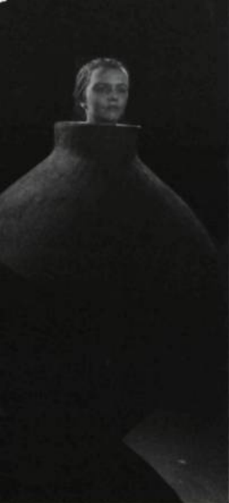
Hey Girl! , spectacle de Romeo Castellucci (Societas Raffaello Sanzio) présenté au FTA 2007.

pu prendre réellement position sur les interactions entre les avancées de la médecine, le culte de la santé et du corps parfait, les discours lénifiants sur la famille, les ruses du marketing et le triomphe sans partage de la surconsommation. Mais, en grande partie à cause du texte décousu cosigné par Normand Chaurette et Carole Nadeau, le public aura dû se contenter d'une vulgaire histoire de trahison amoureuse sur fond de mégascandale scientifique et de gros sous, à peine digne des séries les plus soporifiques que la télévision nous propose à longueur d'hiver.