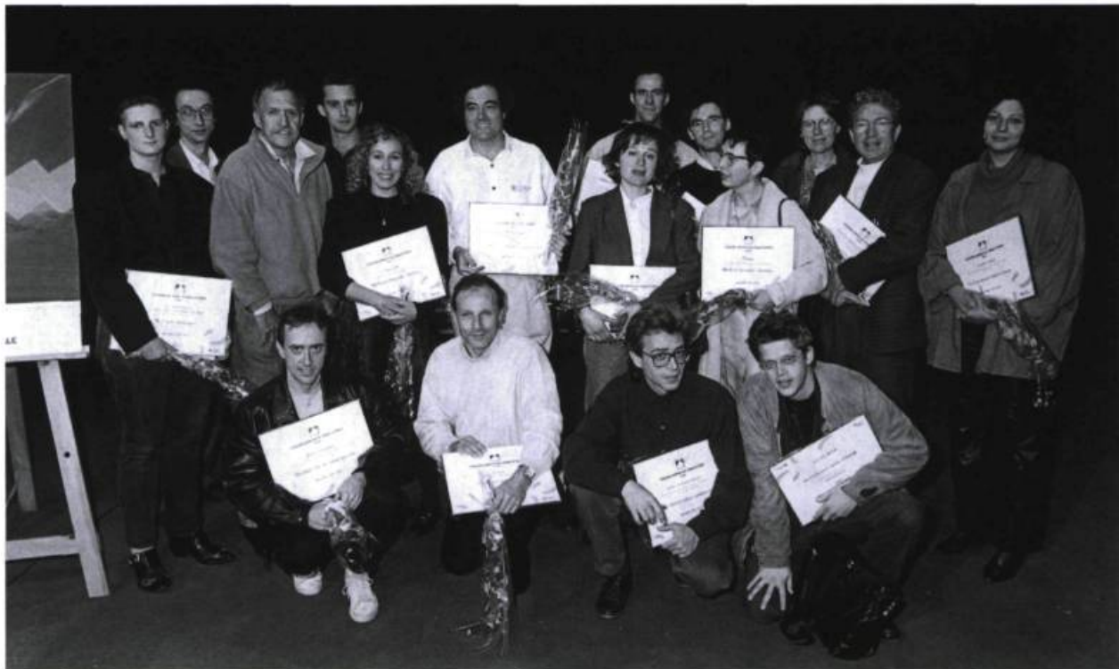
L'attribution des Prix de la critique constitue l'activité principale de l'AQCT. Les lauréats des prix 1989-1990.

d'un vote des membres, alors que les spectacles gagnants sont désignés au terme d'une discussion souvent mouvementée.