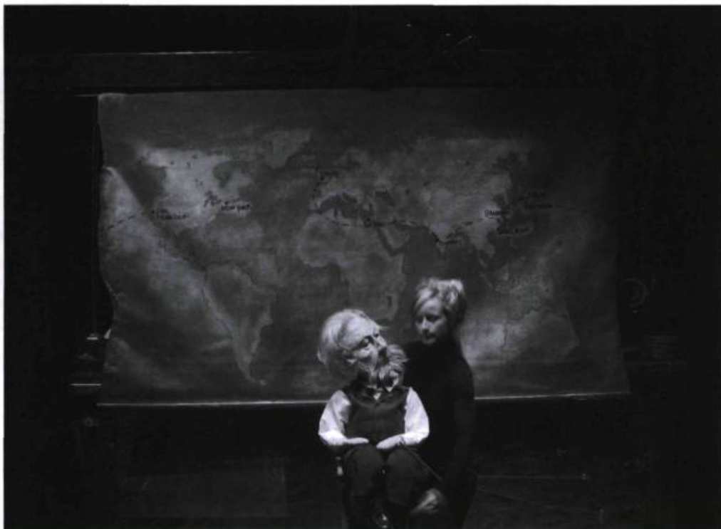
Le Tour du monde en 4 jours , adaptation de Valérie Beaulieu et David Pelletier du roman de Jules Verne, mise en scène par Carl Poliquin (Théâtre du Vieux Coffre, 2006).

toute attente, un pari : il est possible de faire le tour du monde en quatre-vingts jours, et il le prouvera en se mettant en route le soir même. L'enjeu est important : il risque sa fortune. Il part donc avec son nouveau domestique, Passepartout, qu'il vient tout juste d'embaucher. Sur leur route, les périls seront nombreux, et le détective Fix, qui croit reconnaître en Fogg un escroc en cavale, ajoutera aux embûches des deux globe-trotters. Mais voilà, se demande Jules Verne, devenu personnage dans la version présentée à Fred-Barry, cette histoire n'est-elle pas un peu dépassée à l'ère de l'Internet, des téléphones portables et des transports aériens plus efficaces que jamais ? Et s'il la récrivait ? Ses personnages pourraient-ils faire le tour du monde en, disons, quatre jours ?