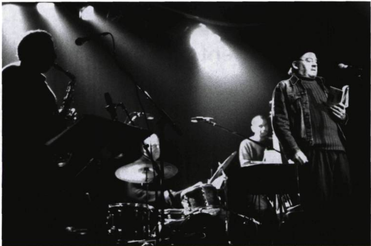
Patrice Desbiens au Festival Voix d'Amériques 2003.

Tiens, l'un de mes rêves serait de voir un jour se créer une véritable troupe, un lieu de création effervescent mélangeant poètes, écrivains, musiciens, comédiens et conteurs, un lieu où tous seraient là pour écouter et apprendre des autres, un lieu où ce qui compte, c'est la sincérité, la générosité, le courage, les remises en question, le partage, l'audace, le respect; un lieu d'où seraient bannies la langue de bois et les conventions.