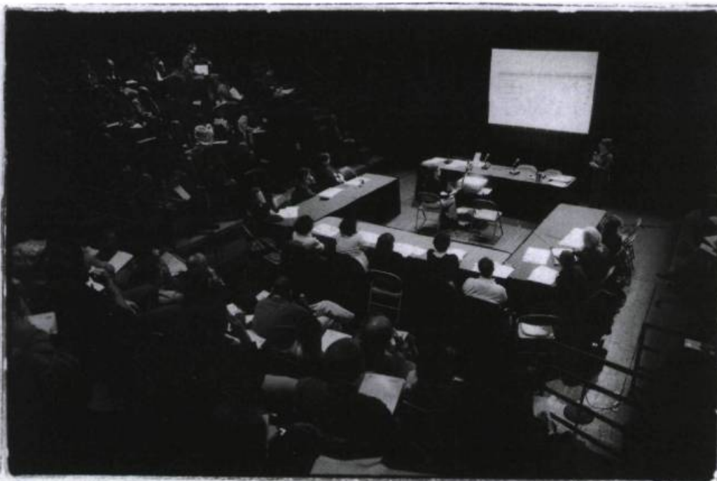
Le 10 e Congrès québécois du théâtre, organisé par le CQT en mai 2003, portait sur les modes de production et la diffusion du théâtre au Québec.