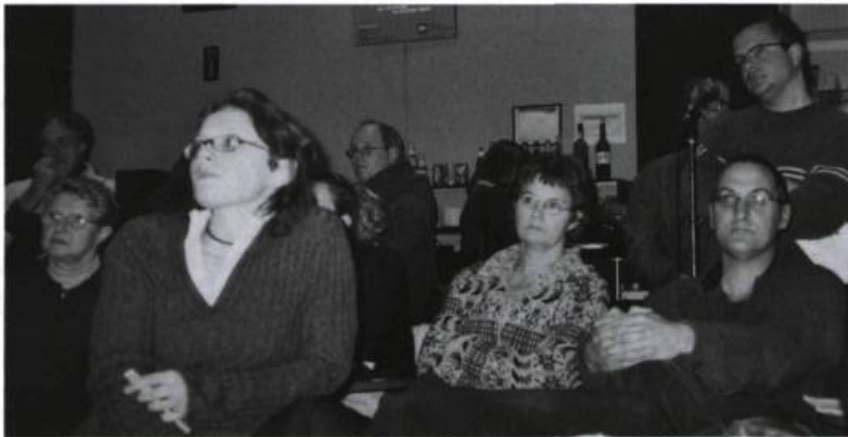
Le public à l'Entrée libre sur la question « Pour ou contre le modèle québécois du théâtre ? », discussion qui s'est tenue au Théâtre d'Aujourd'hui le 3 février 2003.

un, deux ou trois responsables de la promotion et des communications qui mettent toute leur énergie à intéresser les médias. Elle est frappée de voir à quel point les Français accordent moins d'importance à cet aspect (à Paris, il est inutile de penser à des pré-papiers) ; mais, même en province, il y a toujours des gens qui travaillent au développement de public. Lorsqu'elle a été jouée en France, elle s'est trouvée beaucoup plus souvent dans des lycées pour parler de son théâtre que cela ne lui est arrivé ici. Si donc il y a une voie à suivre, même si elle est laborieuse, c'est bien celle de développer le public plutôt que d'espérer une publicité gratuite dans les journaux.