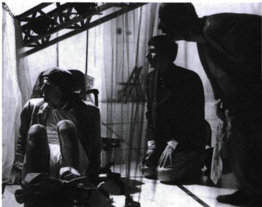
Amerika de Kafka, adapté et mis en scène par Gregory Hlady (Groupe de la Veillée, 1992).

Est-ce le cas avec n'importe quel personnage classique ? Je ne crois pas. Si à la rigueur Alceste est mal interprété, ou Rodrigue, ou même Hamlet, il me restera comme spectateur à me rabattre sur le texte de Molière, de Corneille ou de Shakespeare : je n'aurai qu'à fermer les yeux. Tandis qu'une Macha maladroite rend toute la Mouette inécoutable. Car cette jeune femme vit sur la scène, plus intensément que d'autres illustres personnages du panthéon théâtral.