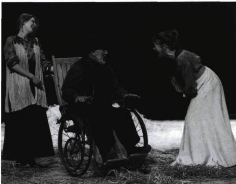
Les Estivants, de Gorki, mis en scène par Serge Denoncourt (Théâtre du Trident/TNM, 1997).

Cette activité n'est évidemment pas sur le point de ralentir, puisqu'à lui seul le Théâtre de l'Opsis a annoncé que ses trois prochaines saisons seraient consacrées entièrement à Tchekhov. Si tout est de la même eau que le magnifique Je suis une mouette, non, ce n'est pas ça , que Serge Denoncourt a proposé au Quat'Sous en janvier 1999, il est évident que nous reviendrons sur le théâtre russe.