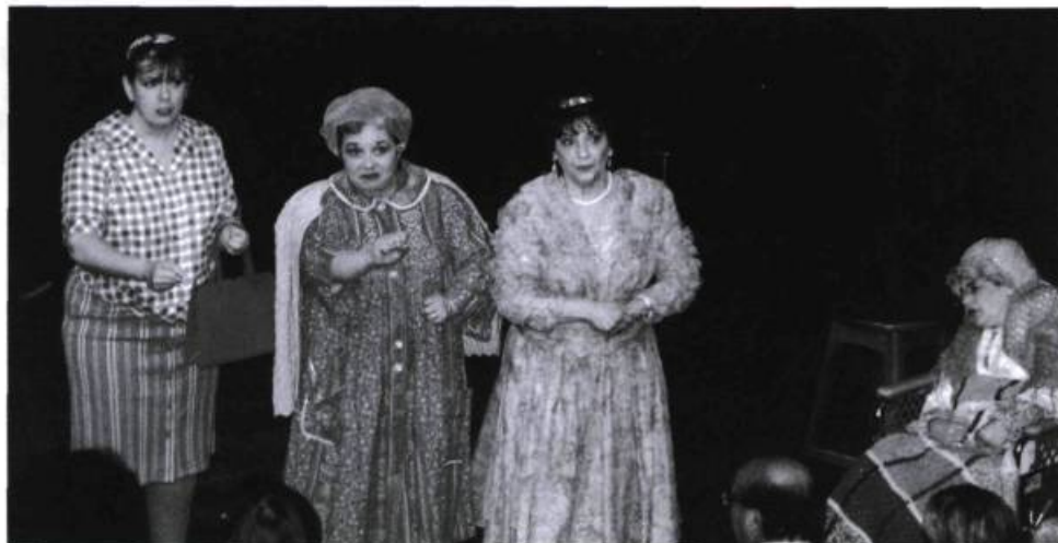
L'« Ode au bingo » en yiddish.