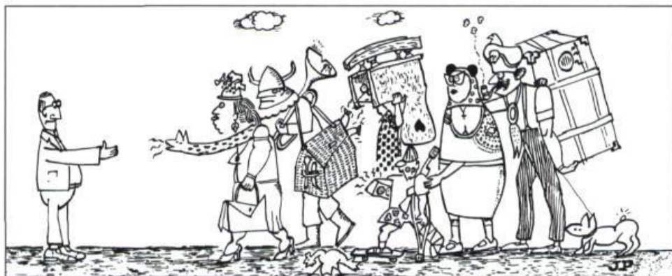
Dessin : Jean-Pierre Langlais.