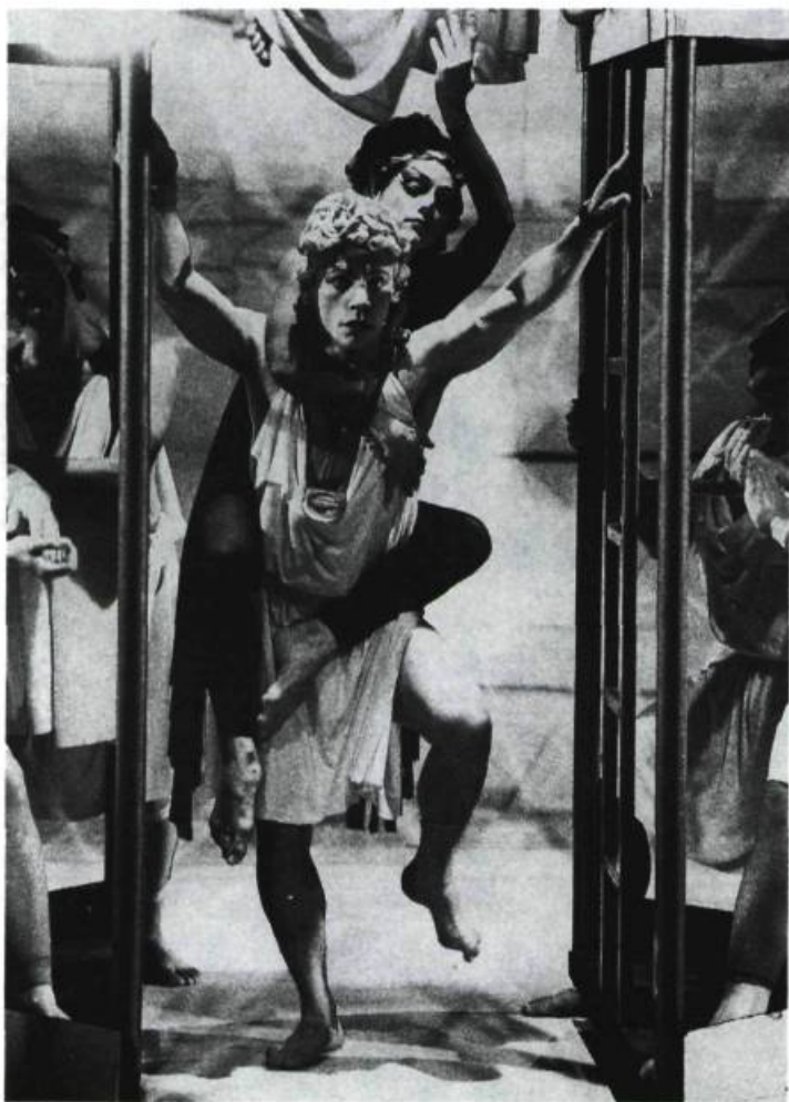
Eurydice , «une déconstruction du mythe par le kitsch».

portance égale aux deux arts, même si les choses sont en réalité moins simples, comme les résultats l'ont d'ailleurs démontré. Ces quatre «jeux» ont été répartis également en deux séances dont chacune a été représentée deux semaines.