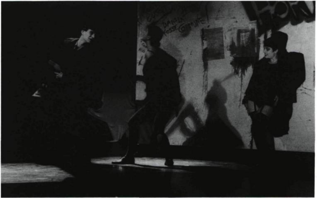
Don Juan revient de guerre de Odon von Horvath, présenté par l'UQAM.

trentaine de comédiens pour le Romeo and Juliet de Bishop; une douzaine pour Ailleurs de l'Université de Montréal et One Flew Over the Cuckoo's Nest de Concordia. À en juger par certaines distributions, le dicton du nombre qui fait la force était largement mis en pratique.