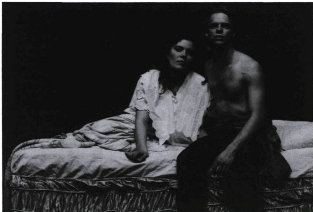
Romeo and Juliet de Shakespeare, production de l'Université Bishop.