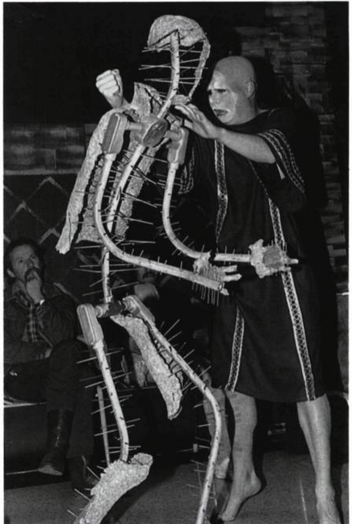
Elagabalus. 1985-1986. Installation-théâtre, «work in progress». «Morts, les autres ne sont pas séparés. Ils tournent encore autour de leur cadavre. Je ne suis pas mort, mais je suis séparé.» (Antonin Artaud, les Nouvelles Révélation de l'être )

«11h15. Onze heures et quart — un temps d'arrêt. Pause cigarette — café évidemment. Brin de rêve d'affiches qu'on aime particulièrement. Ce Teorema — Pasolini. Écrase, évidemment, cette cigarette. Un goût de TV? Bien plus qu'un meuble... Ce n'est pas pour rien qu'il est placé, le téléviseur, dans la mire des jambes étirées ou repliées... Et