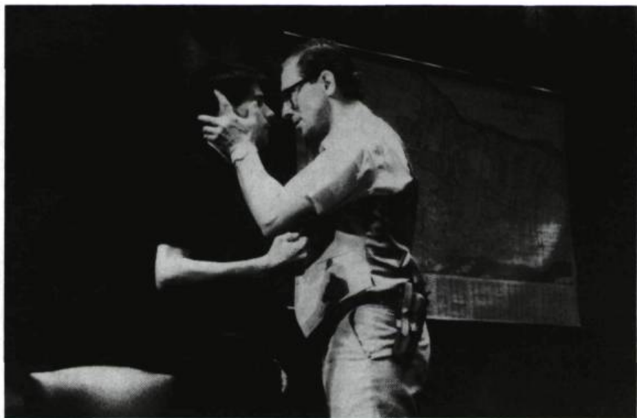
«Deux heures d'empoignades verbales [...] et de demi-confessions successivement rectifiées».

hasard, lequel, on le sait, fait bien les choses, sauf en art, qui lui fait rencontrer ce client providentiel, à la fois juge et homosexuel : une aubaine en l'occurrence. Yves pourra exploiter à son profit la contradiction d'un gardien de loi anomal, au sens étymologique qu'a ici l'épithète. Il se rend ainsi objectivement complice, même si c'est à son insu, de la répression vertueuse dont il est pourtant, et malgré tout, victime. On pourra toujours trouver qu'une telle attitude est compréhensible, voire intéressante... Oui, peut-être, mais elle ne saurait pour autant être approuvée d'aucune manière. La complaisance que manifestent tant le dialogue dramatique que la scénographie ou l'interprétation pour le personnage du jeune prostitué criminel, lequel use et abuse des charmes de son acteur dans de constantes tentatives pour séduire et provoquer on ne sait trop qui, obnubile les enjeux, idéologiques, de la situation.