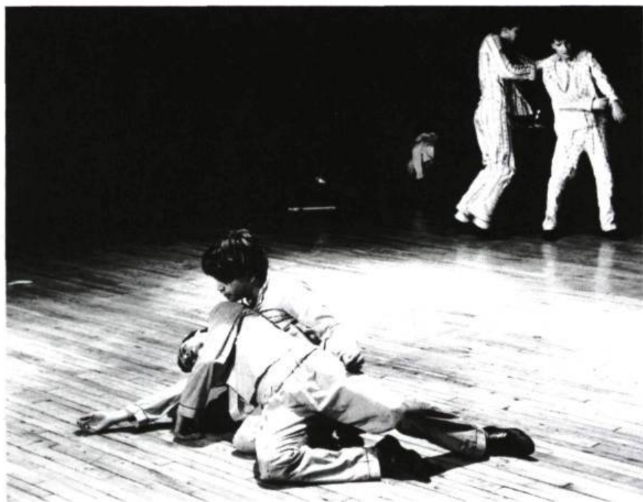
Sur l'esprit de compétition qui teinte les relations masculines: Max Masques X5 de Michel Angers.