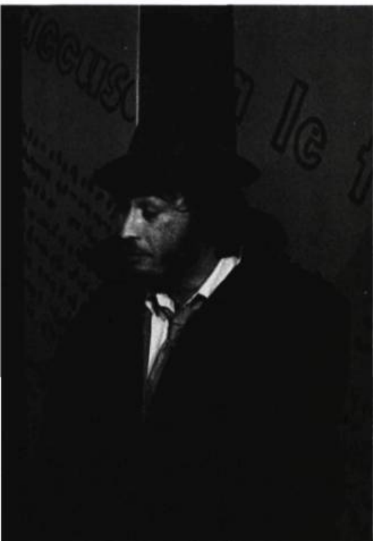
des Gens d'en Bas et du Théâtre d'la Corvée.