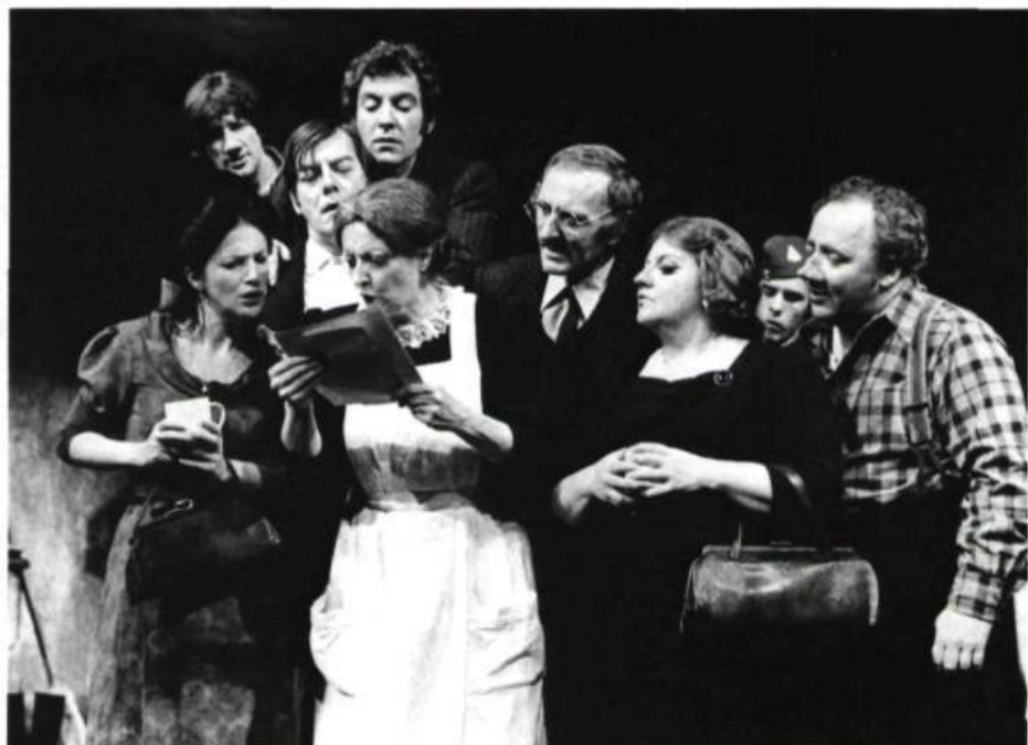
La Guerre, Yes Sir! de Roch Carrier, une production du T.N.M.

l'émotion du comédien. Par contre, je ne cherche pas de trop gros plans: ça ne correspond pas à ce que le spectateur va voir, après tout. Il faut chercher le point de vue du spectateur, oui, mais sous un angle nouveau qu'il n'apercevrait pas autrement. Le photographe est un super-spectateur qui, par une certaine mobilité, voit le spectacle de tous les points de vue.