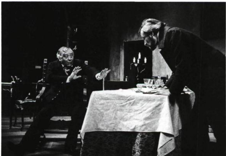
Le Pain dur de Paul Claudel. Production du Théâtre du Nouveau Monde.