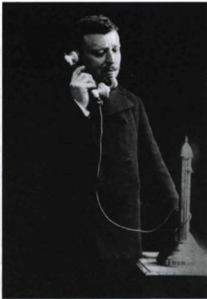
Ermete Zacconi dans le Coup de téléphone d'André De Lorde. Exploitant l'invention récente du téléphone, la pièce se terminait par une scène d'horreur, où le héros appelait à la maison et entendait le meurtre de sa femme et de ses enfants.

de mentir et au public de le démasquer. L'héroïne de la Voix humaine de 1930, paraissant plus grande que nature sur le plateau réduit du décorateur Christian Bérard, contredisait par son désarroi croissant les propos confiants qu'elle tenait à l'homme qui l'abandonnait.