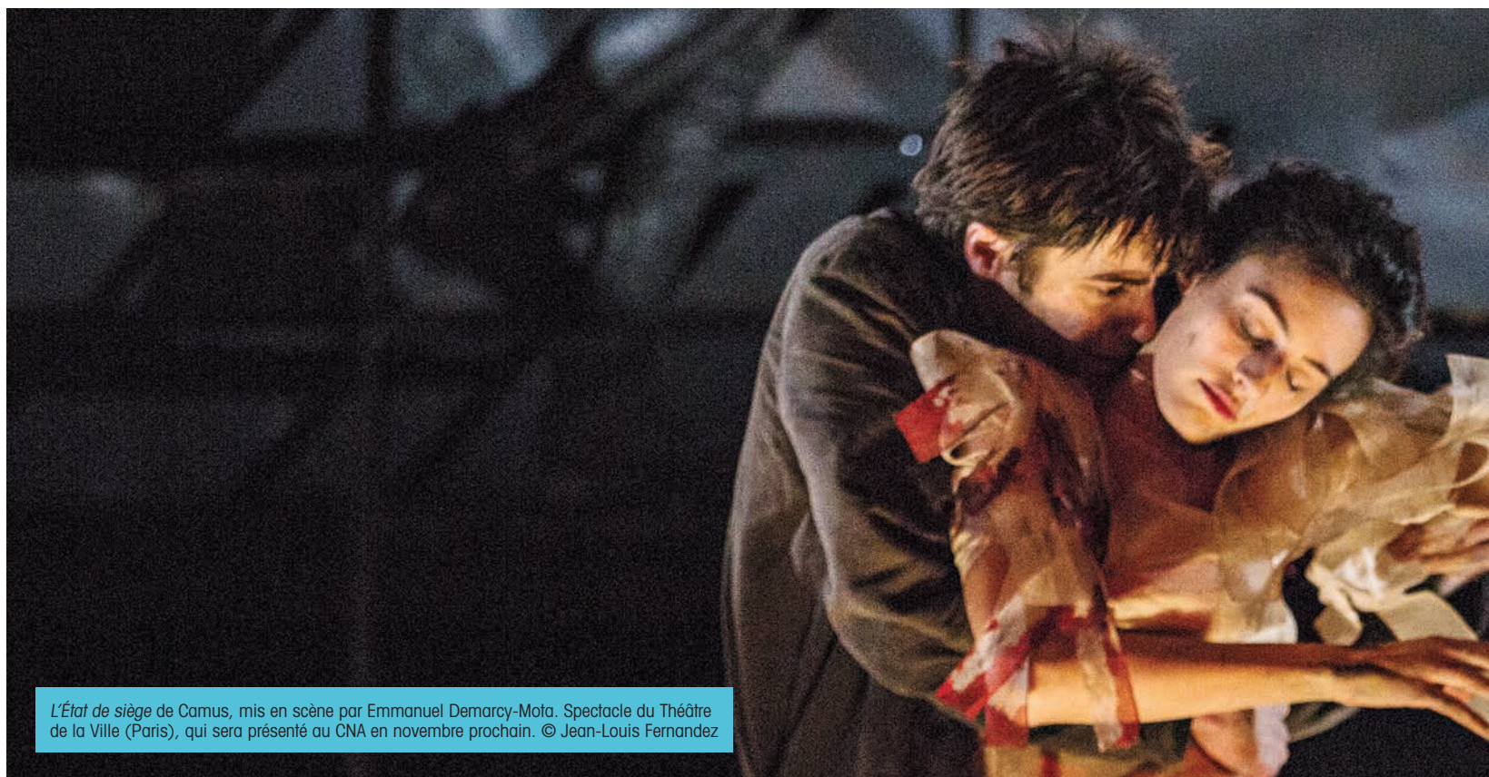
L'État de siège de Camus, mis en scène par Emmanuel Demarcy-Mota. Spectacle du Théâtre de la Ville (Paris), qui sera présenté au CNA en novembre prochain.

Camus situe l'action dans la ville espagnole de Cadix. En 1948, le public rattachait aisément la pièce au franquisme qui sévissait en Espagne, mais aussi au fascisme qui fut si destructeur pendant la Seconde Guerre mondiale, encore récente, et au stalinisme qui s'installait dans le bloc de l'Est; bref, à la réalité européenne de l'époque. En revanche, la mise en scène de Demarcy-Mota ne donne guère à voir un ancrage spatial et temporel: « Nous transmettons au public une perception atemporelle, qui englobe les grandes idéologies du 20 e siècle et leurs excès, autant que la destructivité intrinsèque de l'homme. En convoquant les terreurs passées, la pièce éclaire cette part sombre et en rappelle le caractère cyclique. Nous assistons d'ailleurs aujourd'hui, un peu partout (dont en France, où c'est très visible), au retour du repli sur soi, du rejet de l'autre, à des degrés divers mais toujours lancinants, comme une