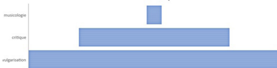
Figure 1: Représentation scalaire des discours sur la musique

Quand la radio est pensée comme un espace de contact entre un public pré-supposé non-initié et des musicologues estampillés experts, tout ce qui se dit sur les ondes est enfermé dans une vision scalaire de la pédagogie. Dans cette représentation pyramidale, ascensionnelle, de la musicologie à la radio, tout ce qui est fait pour démocratiser les musiques savantes revient à répartir ses discours d'accompagnement sur différents paliers et réduire toute parole sur la musique à son niveau de difficulté, sur un seul axe qui va du plus accessible au plus spécialisé.