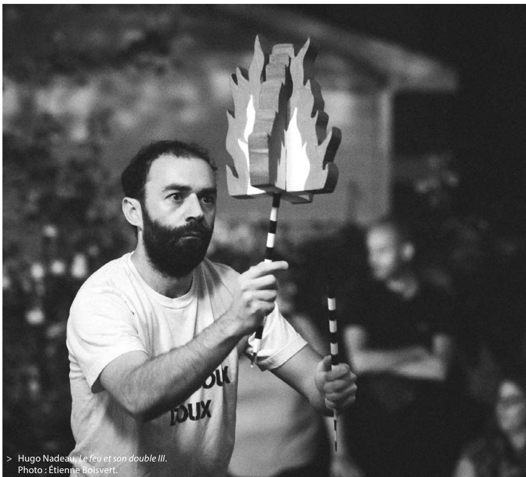
> Hugo Nadeau, Le feu et son double III .

Après la tempête, le calme. Clermont et Langevin affrontent l'extérieur. Chance-lants, ils chutent jusqu'à l'épuisement avant de reprendre leur élan. Leur peau se salit au rythme de leurs cascades. Ils se jaugent et s'appivoisent pendant de longues minutes. Cassant soudainement cette profondeur, ils invitent des spectateurs à mesurer la distance entre eux deux, un moment ludique qui questionne ce désir sécurisant de tout calculer. Puis, après la délimitation de leur