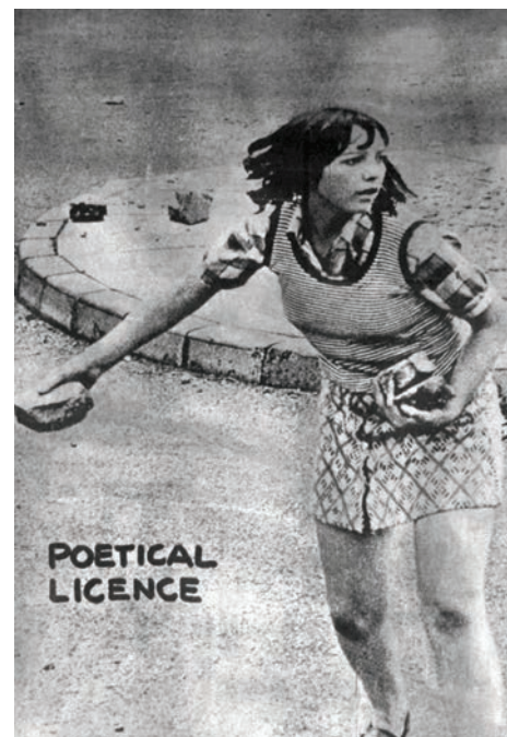
> Arrigo Lora Totino, Sublime essenza obsoleta , Turin, 1976.