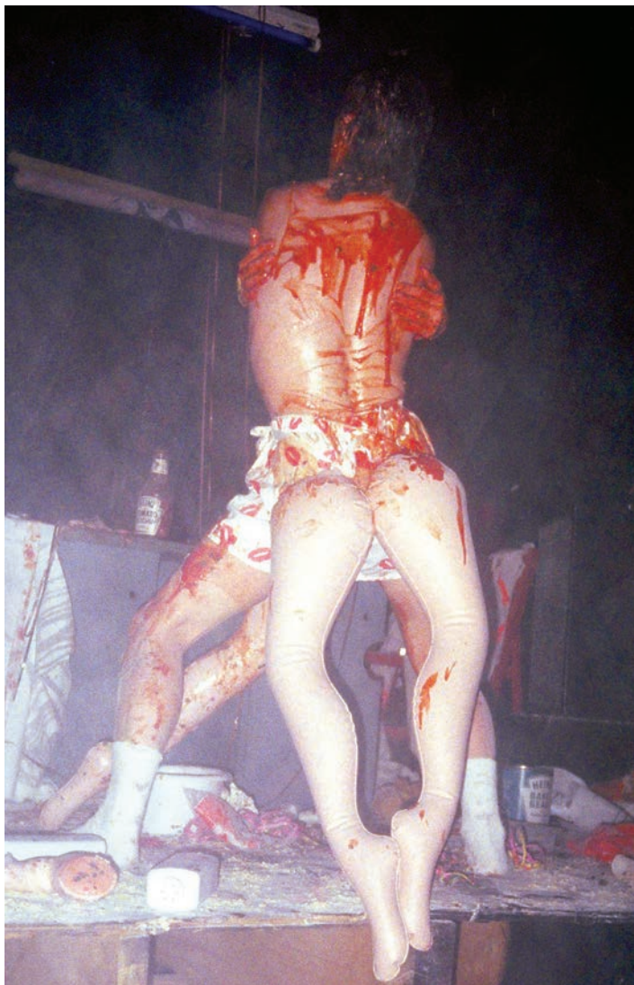
> Fugue States , Zap Club, Brighton, 1986.