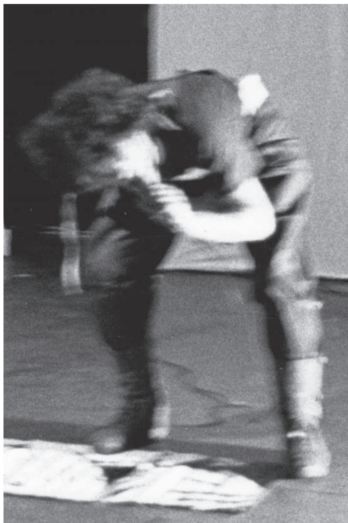
> Conspiracy , Franklin Furnace, New York, 1983.

Ma propre dépendance aux médicaments sur ordonnance et mon régime à base d'alcool et d'amphétamines, avec tout le désespoir, les distorsions mentales et les états de folie désaxés qui en ont résulté, ont eu l'occasion de se manifester dans une série de performances qui, à leur façon, ont aussi contribué à mon effondrement total.