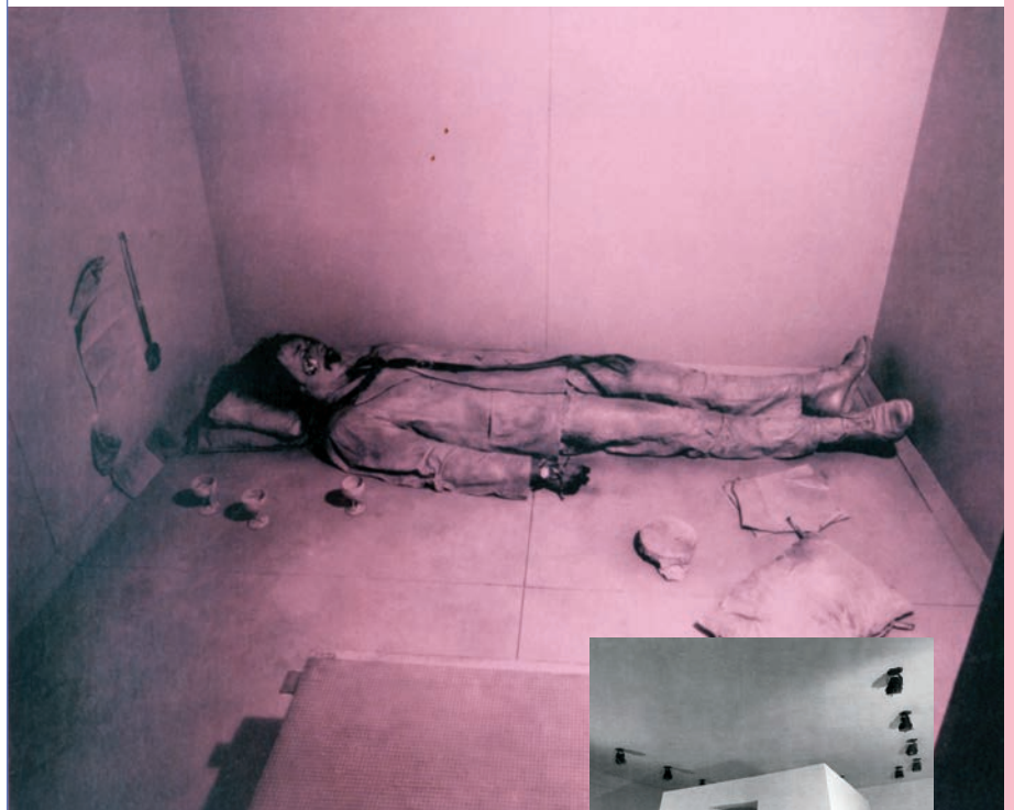
> Paul Thek, The Tomb , vue de l'installation avec éclairage rose, Stable Gallery, New York, 1967.

André Stitt est professeur d'art performance et d'art interdisciplinaire à l'École d'art et de design de Cardiff et à l'Université métropolitaine de Cardiff. Il est membre de la Société royale des arts. Il a travaillé presque exclusivement comme performeur et artiste interdisciplinaire de 1980 à 2012, et s'est forgé une réputation internationale pour son œuvre avant-gardiste, provocatrice et exigeante sur le plan politique. Les communautés et leur dissolution, souvent liée à des traumatismes et à des conflits, et l'art comme proposition salvatrice constituent les thèmes prédominants de sa production artistique. Ses performances et installations (et performances en fonction du lieu) ont été présentées dans des musées et des galeries