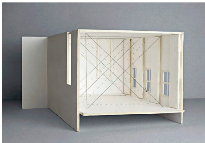
> Maquette pour l'installation Parcourir un carré de toutes les manières possibles pour l'exposition Esther Ferrer , Museum of Contemporary Art, Roskilde, 2001.

Dans les années quatre-vingt, j'ai décidé d'ajouter une action de plus dans la série Parcours .