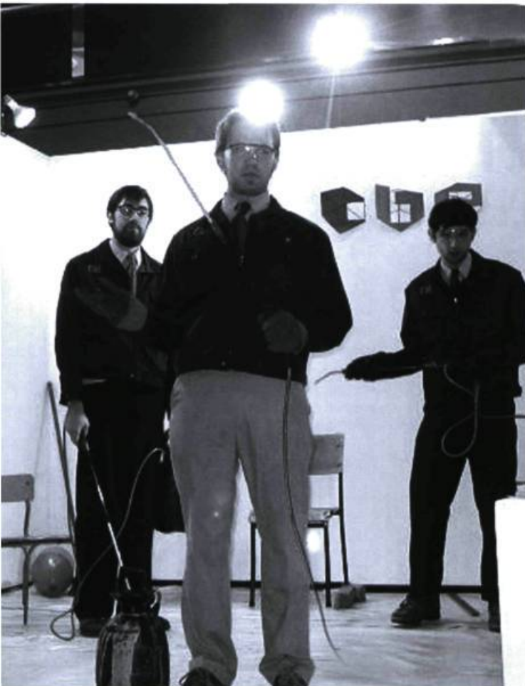
City Beautification Ensemble

d'autres boîtes similaires qui avaient été distribuées autour de la ville soient vérifiées. À l'heure de pointe, tard dans l'après-midi, l'arrêt du traversier a retardé des centaines de personnes. Quelqu'un a averti les médias et soudainement, à la radio, à la télévision et à la une des quotidiens The Daily News et The Mail Star , on annonçait qu'Halifax avait reçu une menace de bombe et que la ville était ciblée par des terroristes. Un mandat d'arrêt pour l'auteur de ce crime a été affiché par la police et, deux mois plus tard, l'individu a été identifié et inculpé. La jeune femme responsable fut introduite dans une section obscure du droit criminel appelée « Diversion adulte », une offense mineure qui stipule qu'elle doit rémunérer une personne ou un groupe lésé – ici le Metropolitan Ferry Corporation – pour la perte de revenus ou compléter 30 heures de services communautaires. Sans aborder la série, quelque peu extraordinaire, de réunions qui se sont