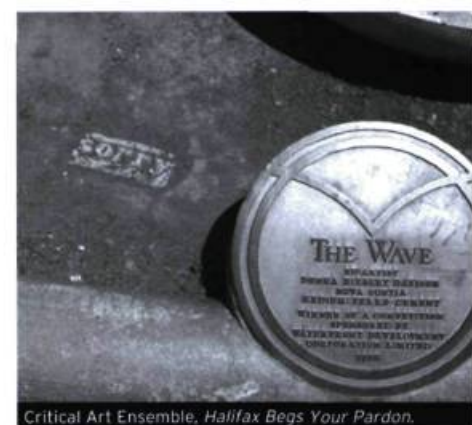
Critical Art Ensemble, Halifax Begs Your Pardon.

Dans une intervention plus récente, le groupe a programmé une série d'activités pour les résidents handicapés de la maison de retraite Kainbach, près de Graz, en Autriche. La maison Kainbach abrite environ 600 personnes affligées d'handicaps mentaux. Quelques résidents ont des maladies sévères et la plupart d'entre eux ont plus de 70 ans. Après leurs recherches préliminaires habituelles, les membres du groupe d'artistes ont organisé un programme d'activités réparties sur un an. Ils ont sollicité la participation de divers établissements locaux, institutions et individus. Plus de 50 donateurs ont proposé de recevoir les résidents de Kainbach pour une activité ou un événement, ce qui leur faisait une visite par semaine entre mai 2003 et mai 2004. Parmi eux, l'association Aquarium et Terrarium a « fait une démonstration d'analyse de la qualité de l'eau et d'identification des espèces de poissons et de grenouilles dans un étang naturel ».