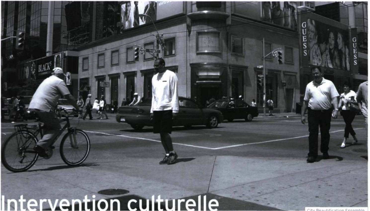
City Beautification Ensemble