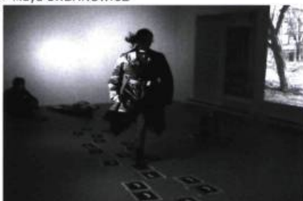
> Anaïs ADAIR