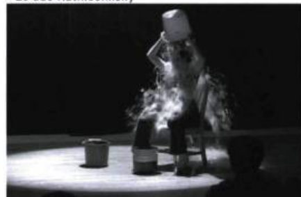
> Marie-Eve PETTIGREW