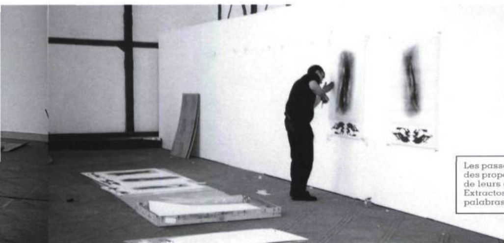
Les passages signalés par un astérisque dans ce texte sont des propos des artistes tirés des documents de présentation de leurs œuvres. Extractos señalados por un asterisco en este artículo son palabras de los artistas sobre sus trabajos.

Tout en faisant référence aux premiers dispositifs de captation photographique de portraits ou de paysages agrandis, les proportions de la structure invitaient à entrer dans le processus même de fabrication des images. Pour saisir le sens de