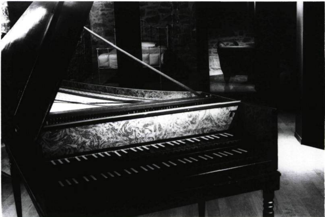
Chambre de Saturne, François VALLÉE.