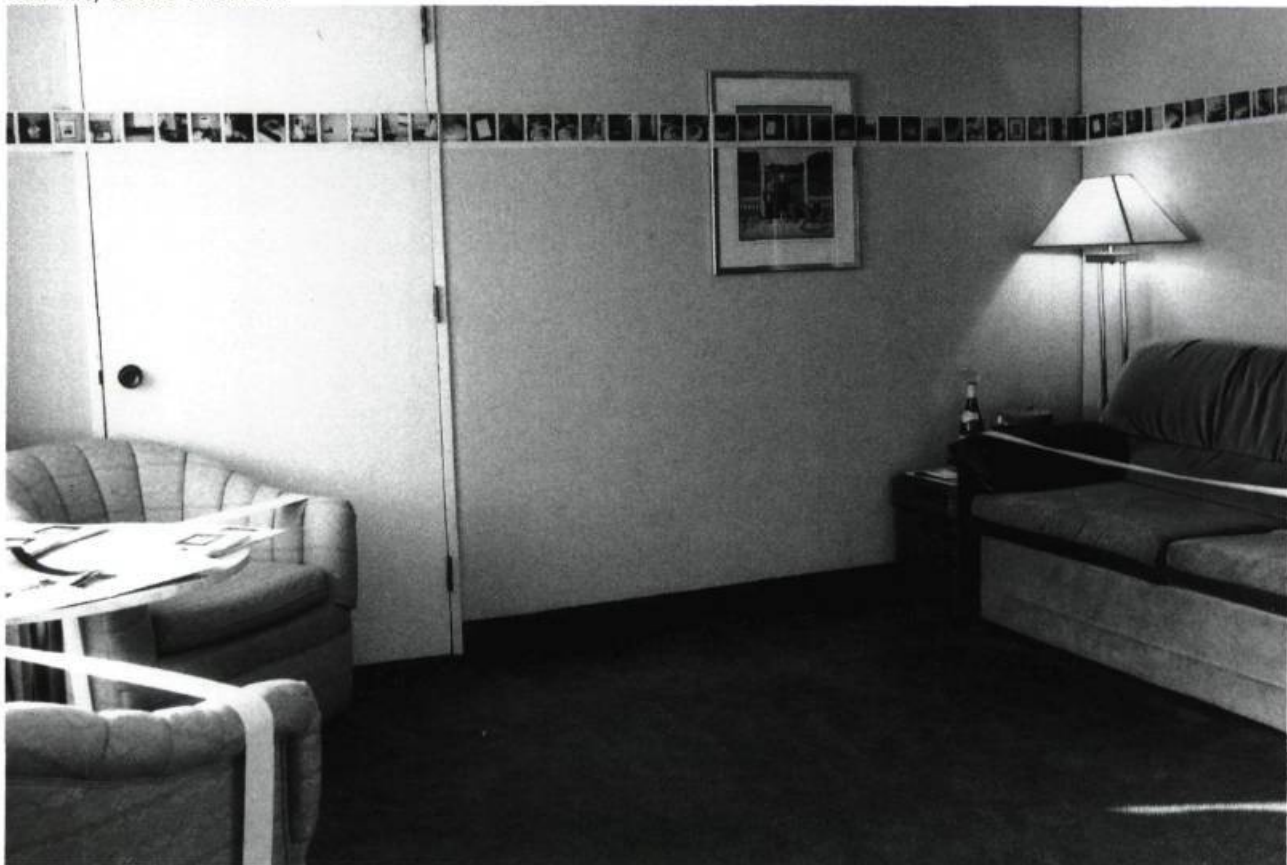
Chambres de naissance , Florent COUSINEAU.