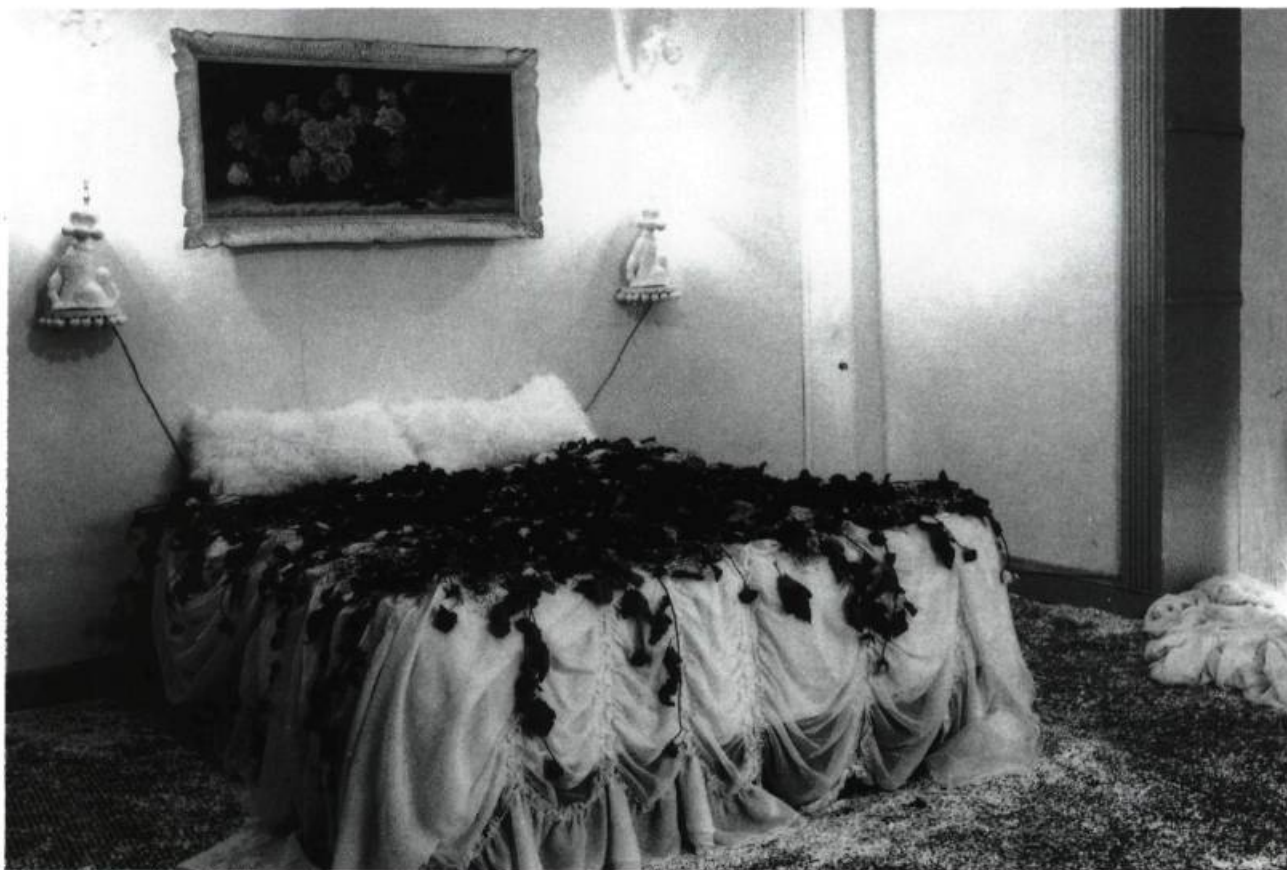
Sans Titre , Claudie GAGNON.

furent invités à investir une chambre d'hôtel de leur questionnement. L'événement eut lieu du 10 au 30 janvier 1993. Une période de 10 jours, soit du 10 au 20 janvier, fut consacrée à la réalisation des installations. Cette période fut ouverte au public qui, pour l'occasion, assistait progressivement à cette entreprise de création publique.