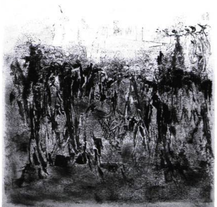
Monique DUSSAULT, 1983.