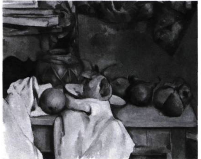
Vase paillé et fruits sur une table, Paul Cézanne, 1895-1900

tableau que le peintre a préparé des chofes dans fon tableau différemment de ce qu'elle font refteées : c'eft-à-dire, qu'il a mis du verd, du rouge, du bleu en certaines places & et qu'on apperçoit plus qu'un refte de chacune de ces couleurs,