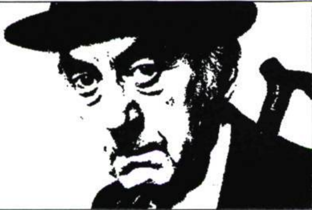
S.C.P. DUCHAMP INSTALLATION ORDINATEUR