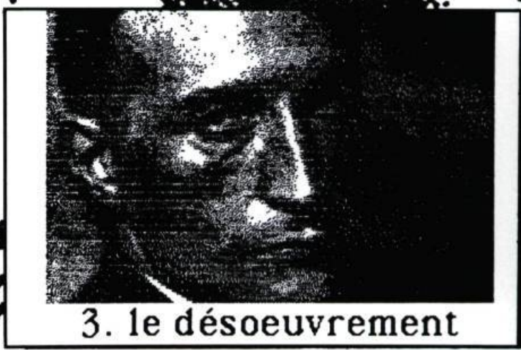
3. le désœuvrement