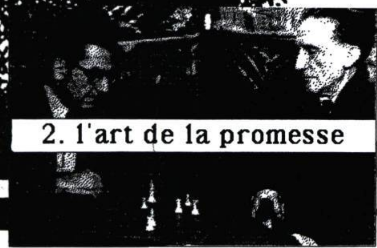
2. l'art de la promesse