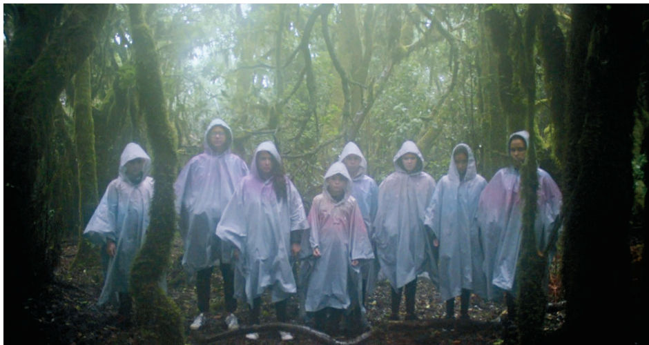
↑ Common Birds de Silvia Maglioni et Graeme Thomson (2020)