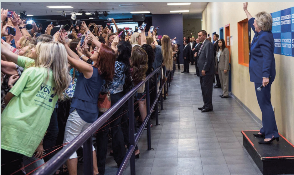
↑ Hillary Clinton : un déluge de selfies, aéroport d'Orlando, 2016